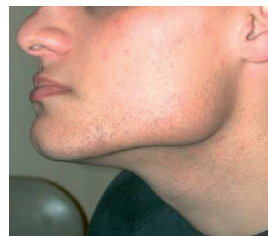
Abbildung 2 – Nach der Behandlung